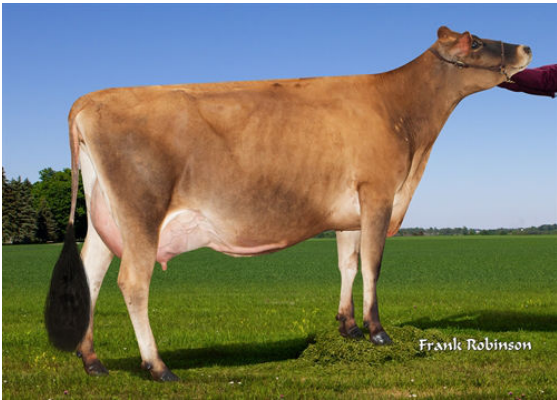
JX PROGENESIS CINDERELLA {6} DAM

JX PROGENESIS MONARCH {5} JX PROGENESIS CINDERELLA {6} DES-77%-2YR-USA JX SUNSET CANYON GOT MAID {5} PROGENESIS CRAZE CORDE EX-90%-5YR-USA RIVER VALLEY CIRCUS CRAZE JX PROGENESIS GRACE TOO {6} DES-73%-2YR-USA